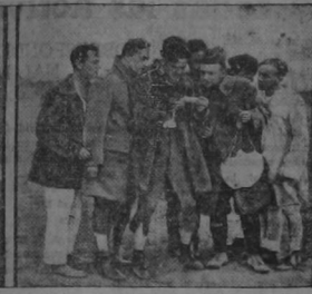
"Un aeroplano enemigo trajo un mensaje..."

EPISODIO No. 8 Al tomar altura, una fila de globos de observación norteamericanos volaba a los alrededores de Alajuela. Desde las casacas o barquillas de estos globos, veteranos oficiales alemanes controlaban con sus anteojos los movimientos de las tropas americanas y dirigían contra ellas la batería de su artillería. Mientras volaban vertiginosamente entre las nubes, David buscaba un vano signo amistoso proveniente de su amigo. Ninguno llegaba. En tanto, los diestros de Jack espistaban a impulso de la cólera que le produciera la acción de