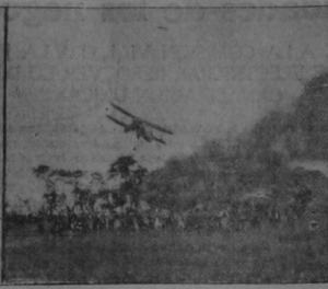
"Lo rodearon, al descender, para felicitarlo"