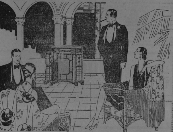
El instrumento que se ilustra en el modelo B-35

Yo estoy enfundado en la milicia del General Ubico. Como yo a fondo su interés y pensar acerca del polígono territorial hondureño-guatemalteco. Ubico es un hombre íntegro, de una estatura moral muy superior. El justifica a Honduras en su reclamo de fronteras sin duda porque observa muchas deshonras titules en la asistencia mutualista del Poder. PORQUE EN REALIDAD DE VERDAD EL PRESIDENTE GENERAL CHACON NO TIENE UN VALLE TAN IMPOLUTO, LO CONTRARIO DE LO QUE SE PIENSA, ES EL SUSTENTADOR DEL CONFLICTO, EL VIVAMENTE EMPERADO PORQUE SE ADJUDICÓ A GUATEMALA LA FAJA DE TIERRA HASTA EL MERIDIANO EN ESTO FUERA DE DEBICIRLO, NO OBRÁ POR INCIUTINA PROPIA, NO ES PRODUCTO DE UN POSTULADO POLITICO NETO DE SU ADMINISTRACION; OTROS RESORTES MUEVEN SUS INTERES. LA UNITED FRUIT COMPANY QUE TIENE EN MIRAS FINALIDADES COMERCIALES Y FINANCIERAS EN LOS CAMPOS RIBERENOS DE PUERTO BARRIOS Y