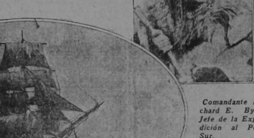
Comandante Richard E. Byrd, Jefe de la Expedición al Polo Sur.

En el capítulo de alimentación Byrd estudió cuidadosamente las experiencias de expediciones anteriores, tal como las de Amundsen y Scott. Con la cooperación del gobierno norteamericano, por medio del "Bureau of Standards", se está haciendo desde hace tiempo ensayos para escoger los alimentos más fuertes y que mejor resistan las condiciones de las regiones antárticas. Experimentos especiales se llevaban a cabo en lo que se refiere a alimentos que eviten el escorbuto, que es la enfermedad que amenaza a estas expediciones, por la falta de comidas frescas y de vegetales. Respecto a sus compañeros, Byrd