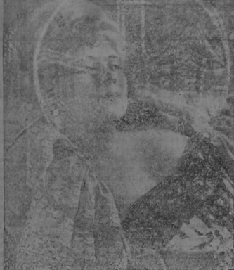
Mae West, la famosa actriz norteamericana que se ha especializado en la representación de papeles sensuales en la escena, y por lo que ya una vez cumplió una condena en la cárcel, ahora acaba de tener un serio disgusto con el empresario del teatro donde la bella artista está actuando, porque quería obligarla a cubrirse un poquito...