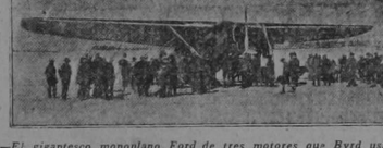
—El gigantesco monoplano Ford de tres motores que Byrd usará para volar sobre el Polo Sur.