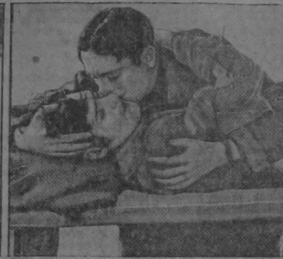
"Tú no me heriste a mí, Jack..."

Epidio No. 11: David, al acercarse hacia las líneas americanas, se sintió rodeado por su éxito. De pronto, vio junto a sí un poco de humo y su aeroplano se estremeció. Mirando hacia abajo, vio que baterías anti-aéreas de las fuerzas americanas le hacían fuego. Y entonces, mirando la cola de su avión, vio la gran cruz negra, insignia de las fuerzas aéreas alemanas plantada en ella, y se dio cuenta entonces de que sus propios compañeros le hostilizarían, tomándole por un enemigo. Todavía en la misma excitación del día, mientras tanto, Jack Po-