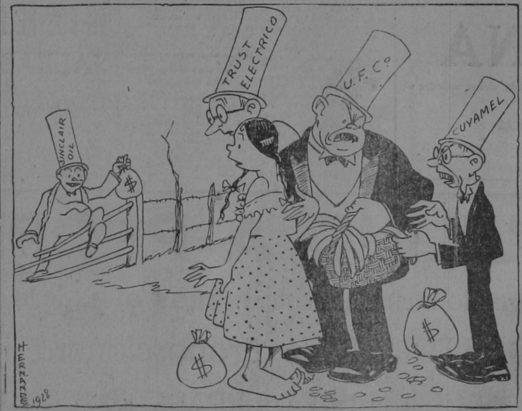
... O la niña es BOCATTO DI CARDINALI, ó creen que no hay hombre en la casa!

“La compañía petrolera Sinclair ha comprado terrenos en el Guanacaste para explotar yacimientos de petróleo”