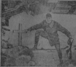
"Arrancó la cruz negra del avión"