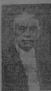
1928 alcanzaba a 1,622,216 habitantes distribuida en 19 departamentos con una extensión de 72,153 millas cuadradas. El Uruguay tiene un total de 1650 millas de ferrocarril de las cuales un noventa por ciento son controladas por capital in-

La República Oriental del Uruguay aparece como una de las más adelantadas de Hispano América por su desarrollo alcanzado no sólo desde el punto de vista económico sino constitucional, desde cuyo punto de vista marcha al frente de la vanguardia de los países más avanzados de Europa y América. Su primera constitución fue promulgada en 1830. Un número de emiendas fueron hechas posteriormente desde 1830 a 1917. Sin embargo el 15 de octubre de 1917 fue adoptada una constitución que contempla cambios muy radicales y establece un régimen de gobierno que no se inspira en ningún otro estatuto constitucional sino en la propia experiencia realizada en casi noventa años de organización política. El rasgo fundamental de la actual Carta Política es la división del Poder Ejecutivo, la práctica de las instituciones políticas de la Constitución jurada el 18 de Julio de 1830 demostró que la amplitud de funciones del Presidente de la República era un peligro para un régimen de efectiva libertad democrática así como para la libre acción de los partidos organizados. Se sugirió