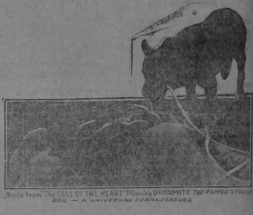
Scene from THE CALL OF THE HEART. Playing at THE MODERN THEATRE.