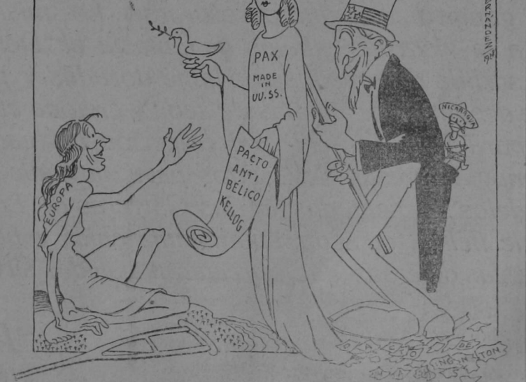
¡Y pensar que haya quien se preste a ser comparsa de semejante farsa!

"A firmar el pacto Kellogg serán invitadas cuarenta y cinco naciones".