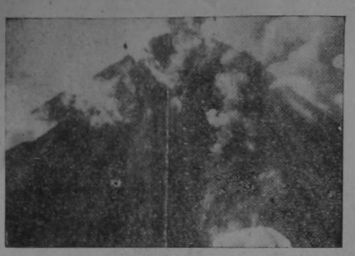
A la izquierda, el volcán Mayón de las Islas Filipinas en este desparpado. A la derecha, el tren de La Cruz Roja al salir, para atender a las víctimas de la candente lava.