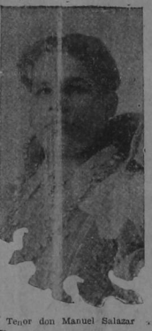
Una noticia muy grata tenemos que transmitir a nuestros lectores, que es la siguiente: Leyendo la prensa española que acabamos de recibir nos encontramos con un reportaje dado a varios diarios...

El empresario de esos teatros dice que Salazar es el sucesor de Tamagno