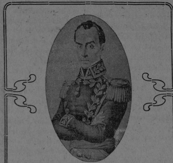
El Libertador SIMON BOLIVAR

Venezuela, Colombia, Ecuador, Perú y Bolivia forman la espléndida corona que brilla en su gloriosa cabeza.