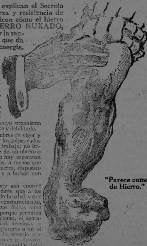
"Parece como de Hierro."

Representantes para por mayor: The Costa Rica Mercantile Co.