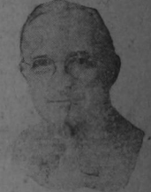
Presidente HARRY TRUMAN sigue en nuestros esfuerzos por mejorar las condiciones del pueblo.

guerra, ella será muchísima más democrática cuando sea el retorno de los cañones y los hombres de estado hagan frente a la tarea de unir de nuevo al mundo en la cordura. El brotar entonces de la fe luchadora de