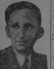
Sir Arthur Tedder, Mariscal de la Aviación, cuyas nuevas técnicas empleadas en Africa fueron factor decisivo de la victoria aliada.

Los ejércitos británicos conquistaron la totalidad del gran territorio colonial italiano en Africa, de una extensión de 1.346.000 millas cuadradas y de una población de 12.988.000 habitantes. Durante las campañas africanas fueron capturados o destruidos por las tropas británicas y aliadas 2.500 tanques, 6.200 cañones y 70.000 camiones.