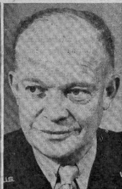
Dwight D. Eisenhower

Advertiendo que el desarme individual de las naciones es por sí mismo un camino peligroso para la paz duradera, el Jefe de Estado Mayor abogó por el desarme universal y progresivo, que daría los siguientes beneficios resultados: