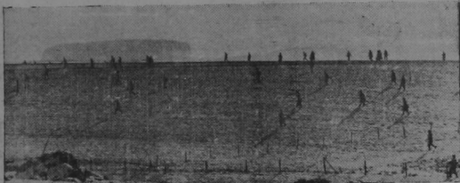
Infantería de los Estados Unidos atraviesa un campo a la indecisa luz del amanecer para atacar baterías nazis ocultas en los bosques que se ven al fondo, en un sector del frente occidental.

Uno de los altos personeros de la Northern Railway Company, que estuvo de visita en esta ciudad hace algunos días, hizo manifestaciones en extremo interesantes sobre los propósitos de la citada empresa para la reparación de los muelles de esta ciudad haciéndole trascendentales reformas que facilitarán el servicio de muelles notablemente.