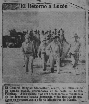
El Retorno a Luzón

cia y no sabemos que puedo hacerse para obligarlo a que lo surta debidamente, pero hacemos la publicación de los hechos en la esperanza de que sea el dueño o sean las autoridades de ese lugar solución las dificultades que se presentan a los vecinos y que nos parecen graves