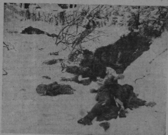
Los muertos alemanes yacen sobre una carretera cubierta de nieve en el frente occidental, donde cayeron después de una infructuosa tentativa de romper las líneas estadounidenses. Los nazis sufrieron numerosas bajas en el contraataque que siguió a su efímera ofensiva.