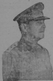
Genl. DOUGLAS MCARTHUR

In fulfilment of his promise, made in 1942, General Douglas McArthur arrived in Manila, the capital