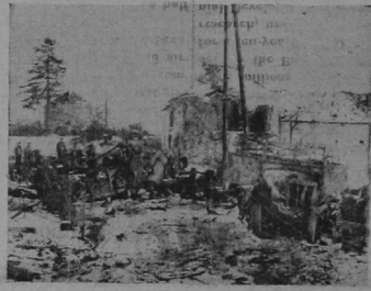
En una aldea del frente occidental soldados de los Estados Unidos examinan los restos de varios vehículos blindados del ejército nazi, destrozados por el fuego de la artillería estadounidense.