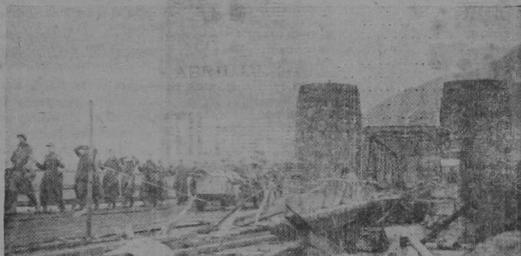
Soldados estadounidenses cruzando el puente ferroviario ocupado en Remagen, sobre el Rin, mientras los prisioneros nazis marchan en sentido opuesto rumbo a los campos de concentración. La rápida ocupación del puente frustró los planes alemanes de destrucción y llevó a los ejércitos de invasión al otro lado del Rin, para arremeter en la profunda del territorio alemán.