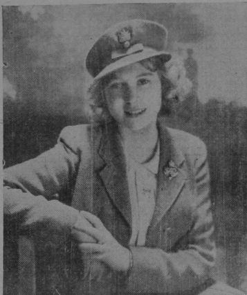
H. R. H. Princess Elizabeth

It has long been stated that the Princess displays a marked proficiency in all the traditional requirements necessary for the efficient and successful carrying on of the arduous duties and far-reaching responsibilities of a British Monarch. She is also said to be possessed of a charming disposition coupled with a genuine desire to