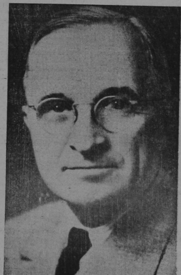
El Presidente Harry S. Truman, nuevo Presidente de los Estados Unidos, al ocurrir la inesperada muerte de Franklin D. Roosevelt. Antes de ser electo vicepresidente de la nación, el Presidente Truman fue miembro del Senado de los Estados Unidos, por el estado de Missouri.

Se ha mencionado a menudo el nombre de Janina en los partes de guerra griegos e italianos. Janina sumi- nistra el caso raro de una ciudad cuyo tamaño no ha crecido en decrecer. Tiene una población de veinte mil almas, menos de la mitad con que contaba hace siglo y medio. En 1912, durante la guerra balcánica, se habló mucho de ella, pues resistió un largo asedio. La ciudad es el centro de una gran industria: el recamado de oro y plata. Además, durante un tiempo su zona estuvo infestada de bandoleros. Numerosos de- lincuentes tenían sus cuarteles en los alrededores de Janina. Algunos de ellos se dedicaban al contrabando por las fronteras de Albania y Yugoslavia. Se refiere una curiosa anécdota acerca del principal bandido de Janina. Las autoridades ofrecieron una gruesa suma por su cadáver. Pero el bandolero, que tenía fama de rico, neutralizó esta iniciativa anunciando que había dispuesto la entrega de toda su fortuna a quien diera muerte a su víctima. La remuneración oficial no fue reclamada jamás.