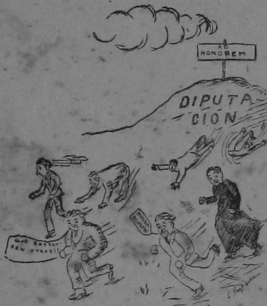
pues salieron dando vuelta más de mil diputaciones.