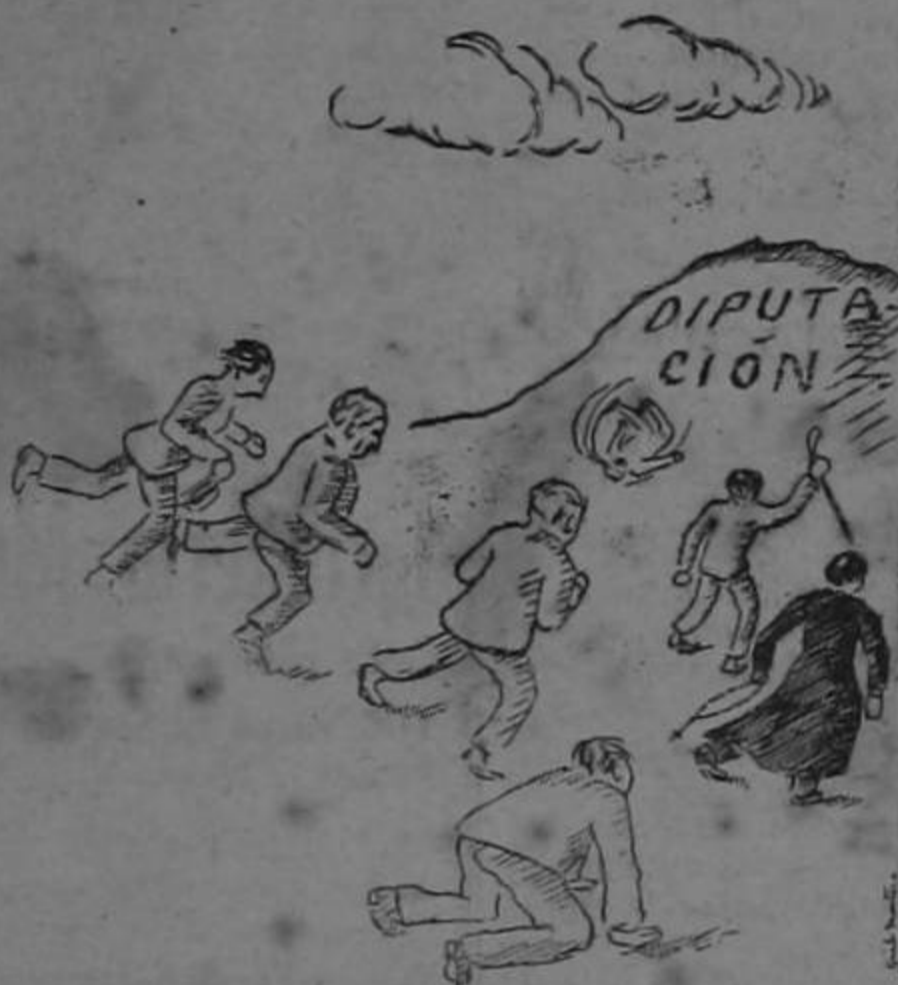
Pobrecitas ambiciones con pasaje de ida y vuelta,