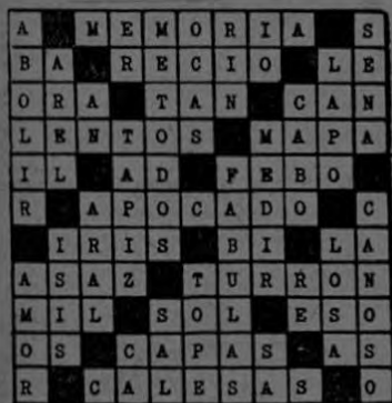
Solución al Crucigrama N° 19.

Vea la solución de este crucigrama N° 20 en nuestra próxima edición.