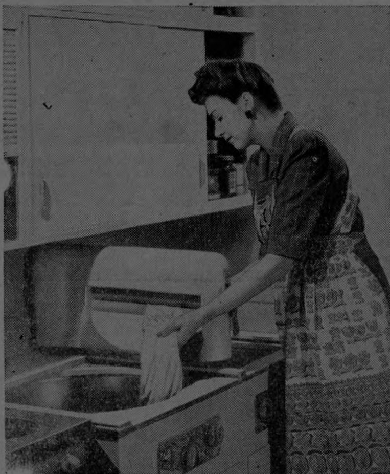
LAVADORA MECANICA ELECTRICA EN USO

El ama de casa en la fotografía pasa una prenda por la máquina en cargada de sacarle el agua antes de ser tendida. La prenda está siendo sacada del tanque de lavado. El equipo deshidratador una vez terminada la tarea, por medio de un juego de bisagras, se dobla hacia la pared, dejando el espacio libre para el trabajo en los tanques.