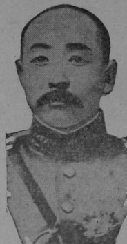
LA MUERTE DEL AMO DE LA GUERRA DE CHINA

Chang-Tso-Lin, el General Cris-cuya muerte dieron cuenta hace po-tiano y Dictador de Manchuria, de los cables. Chang-Tso-Lin, se elevó hasta el poder después de haber sido solo un vulgar jefe de bandidos. Cuando la guerra ruso-japonesa ayudó al japon en la gran lucha, Chang-Tso-Lin fue durante algún tiempo un factor político importante en Oriente.