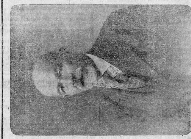
LIC. DON CLETO GONZÁLEZ VIQUEZ CANDIDATO A LA PRESIDENCIA DE LA REPÚBLICA PARA EL PERIODO CONSTITUCIONAL DE 1928 A 1932