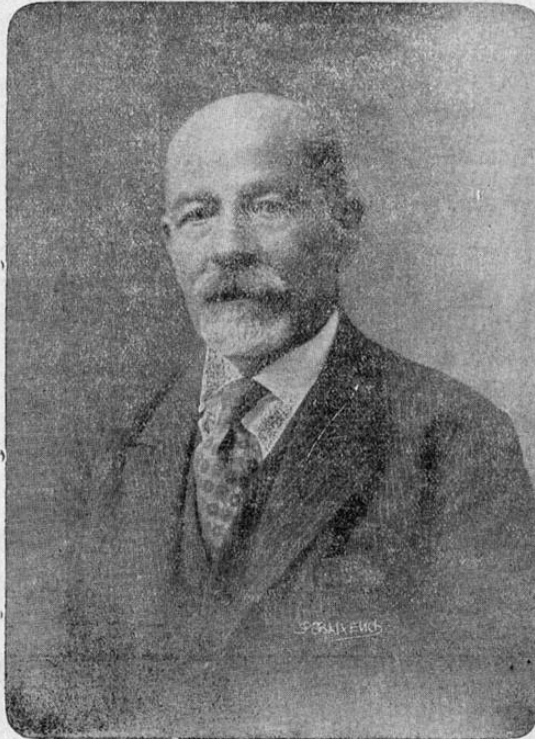
LIC. DON CLETO GONZÁLEZ VÍQUEZ CANDIDATO A LA PRESIDENCIA DE LA REPÚBLICA PARA EL PERÍODO CONSTITUCIONAL DE 1928 A 1932