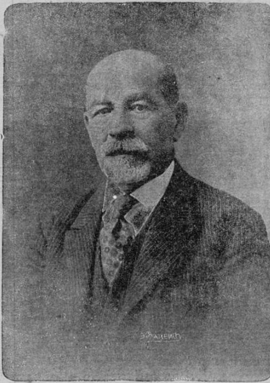
LIC. DON CLETO GONZÁLEZ V.QUEZ CANDIDATO A LA PRESIDENCIA DE LA REPÚBLICA PARA EL PERÍODO CONSTITUCIONAL DE 1928 A 1932