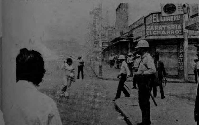
Hay que caer al que dice la verdad. Hace 2.000 años a Cristo, hoy al pueblo guatemalteco.

La miseria y el hambre azotan a más de la mitad de los hogares costarricenses, mientras una minoría nada en la opulencia y el lujo. Esta trae como consecuencia un horroroso comercio sexual que se extiende a amplios sectores de la población joven costarricense de ambos sexos. La delincuencia, las enfermedades mentales, y toda clase de degradaciones sociales tienen alarmado al pueblo costarricense por su crecimiento en los últimos años.