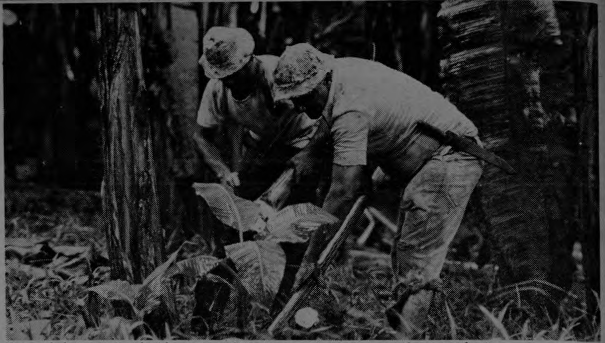
Como a Jesús la cruz, las injusticias van matando poco a poco al campesino costarricense y su familia.

No es cierto que el terremoto haya afectado por igual a todos los guatemaltecos. Pero sí es cierto que un sector minoritario de Guatemala lo proclama para beneficiarse de las medidas de emergencia y de la solidaridad internacional, mientras que las verdaderas víctimas del terremoto no han hecho más que aumentar su miseria y postrarse en una mayor opresión.