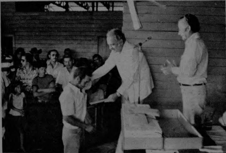
TRESCIENTAS ESCRITURAS ENTREGO EL ITCO EN CHAMBACU. — El Sr. Presidente de la República Lic. Daniel Oduber Quirós, el pasado sábado entregó escrituras a colonos del ITCO en Chambacú. Además recorrió varios asentamientos del ITCO.

En los asentamientos del ITCO tenemos buena gente y luego ese otro complemento, tierra, recurso natural que Dios dejó de hacer y que lo tenemos como un factor limitado en cantidad y que solo con más técnica la vamos a ir haciendo relativamente mejor aprovechable y obtener así mejores cosechas. Tenemos también que transformar esta tierra y se está logrando, gracias a la decisión del gobierno. . . del Sr. Presidente de la República Lic. Daniel Oduber Quirós, quien ha impulsado la compra de tierras que antes estaban ociosas.