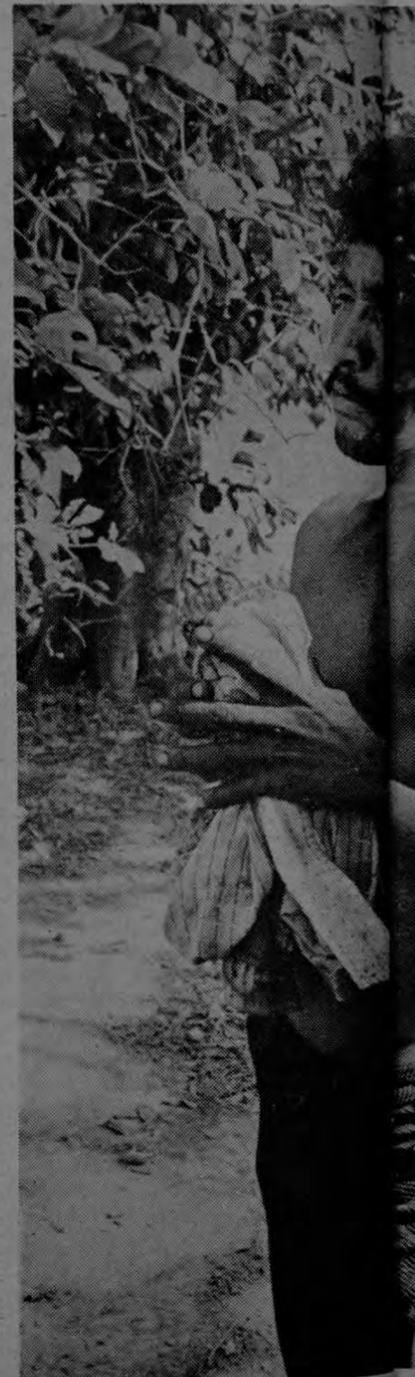
El rostro de Jesús es el rostro de los pobres marginados y oprimidos.