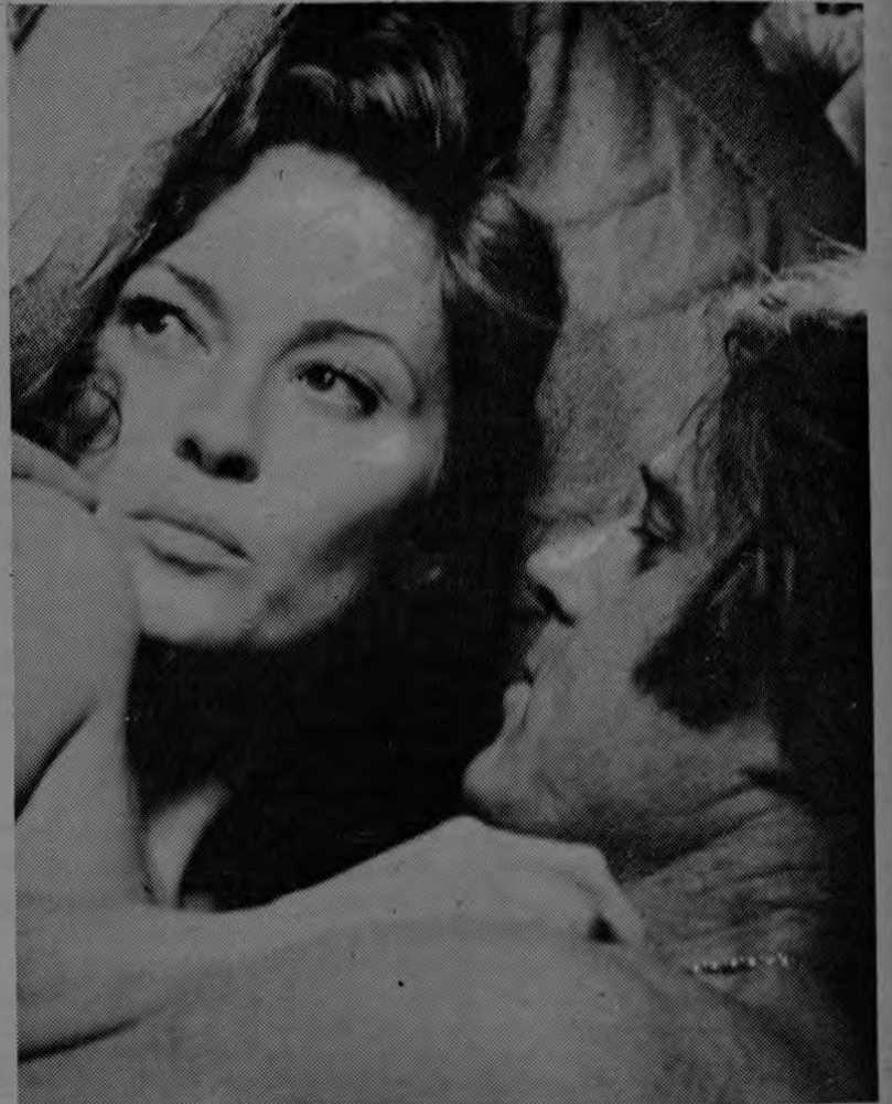
DUNAWAY Y REDFORD

El final de la película no es un clásico "happy end". Redford logra llegar a un gigantesco diario de New York en donde ha denunciado los hechos y de la publicación de estos depende su vida y su tranquilidad.