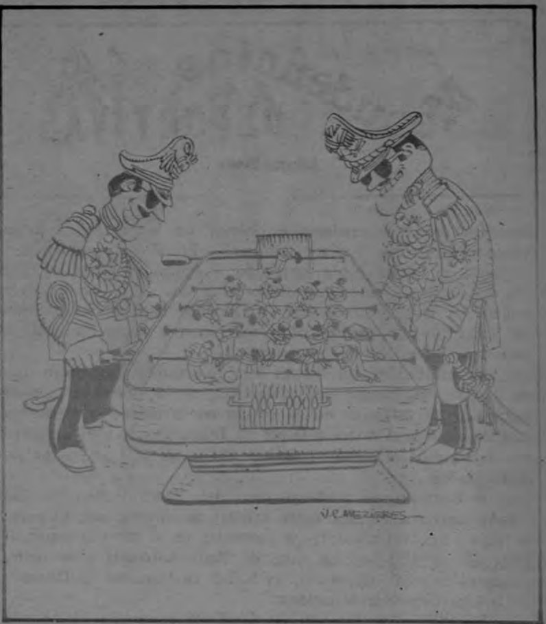
Esta caricatura publicada en Honduras satiriza el juego político que hicieron los militares argentinos en el Campeonato Mundial de Fútbol. Argentina se encuentra a la cabeza en la violación de los derechos humanos, según el informe anual de Amnistía Internacional recientemente publicado.

En un párrafo que parece haber sido escrito pensando en algunos de los países de América Central se dice que "las fuerzas de seguridad y grupos paramilitares han sido usados como