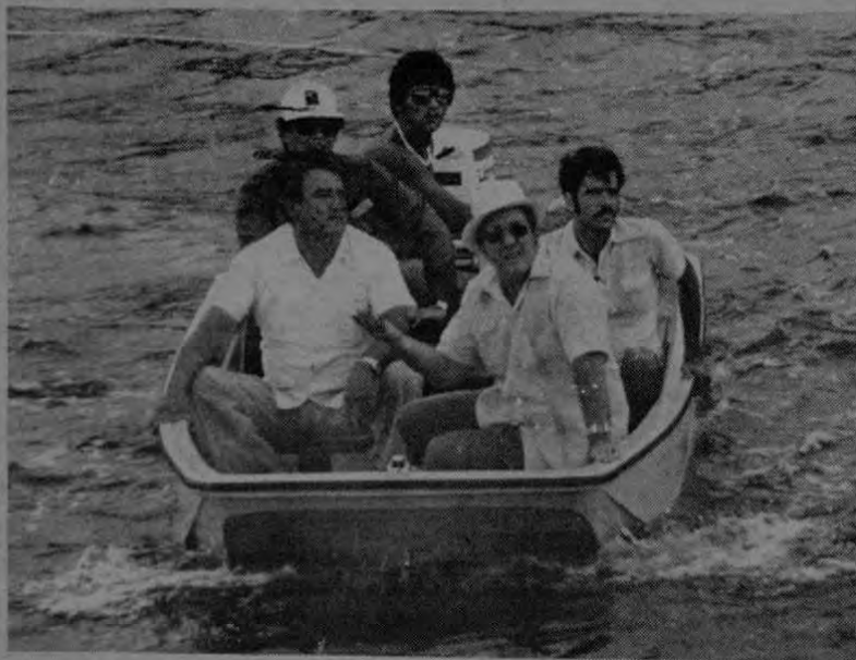
El Presidente llega a la isla a bordo de un bote con motor fuera de borda.

Este tesoro, ubicado en esos 500 kilómetros de mar patrimonial, está representado, sólo en una parte por la gran concentración de atún, que es la mayor del mundo y que se da, precisamente, en esas aguas del Pacífico Oriental y que ahora