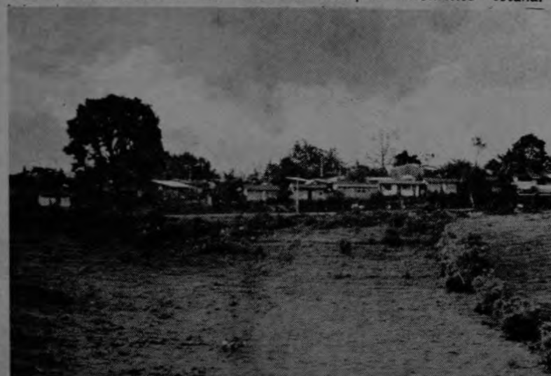
Vista del barrio La Mora, en Ipís de Goicoechea.

Como no hay agua, mucho menos pueden haber cloacas y las modestas casitas apenas tienen un patio que no llega más allá de los cuatro metros cuadrados. En esa