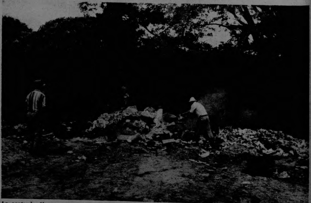
La contaminación por desechos y basuras presenta problemas aún en el área rural. En Costa Rica aún no se toman resoluciones adecuadas para resolver la situación ya que aunque existe un relleno sanitario en Río Azul de Desamparados, éste ya resulta insuficiente.

"Los criterios ecológicos deben prevalecer sobre los económicos, los sociales y los políticos", terminó diciendo.