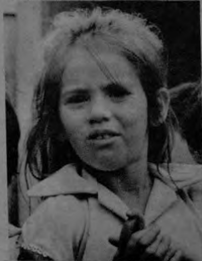
Una de las niñas que habitan La Mora. La civilización moderna parece cosa de un libro de Julio Verne con relación a barrio.

Comprenderán ustedes también, que la acción deforestadora de los terratenientes colindantes a La Mora, muy pronto convirtieron la quebrada en otra cosa. Hoy, es apenas un chorrito de agua, que con grandes esfuerzos, trata de no quedarse, aunque no siempre lo logra, estancado en lo quebrado del terreno.