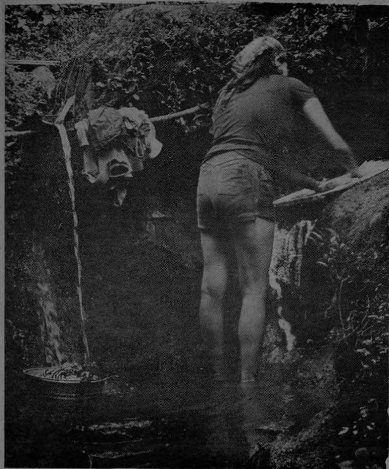
Esta es la forma de lavar su ropa, cocer sus alimentos y asearse de los vecinos de La Mora de Ipís de Goicoechea. El tener que usar una acequia con desechos industriales es sólo uno de sus males.