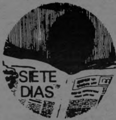
DOMINGO: A remate desaparecido periódico Excelsior.