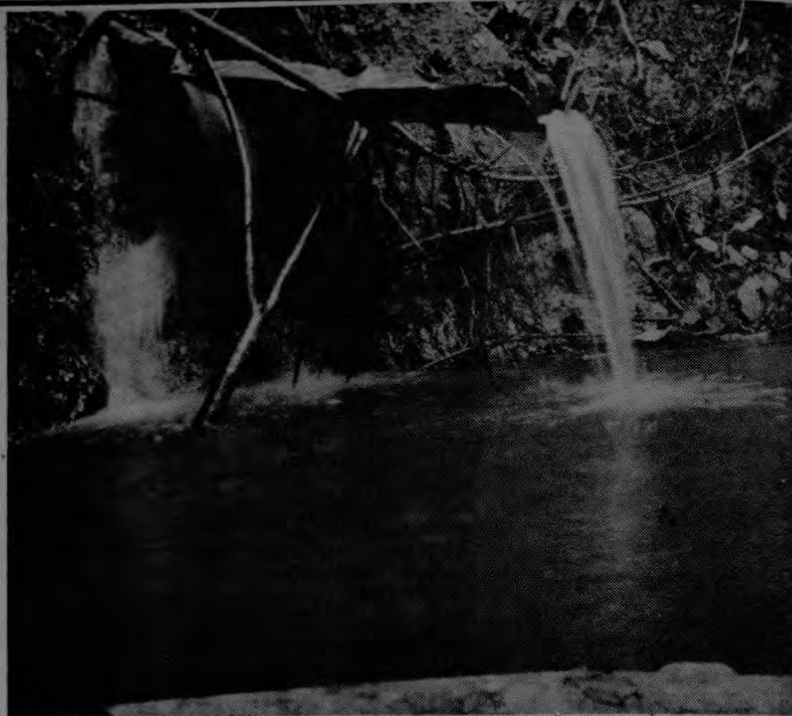
Pozo que sirve de fuente de agua potable a los vecinos de La Mora. Allí confluyen toda clase de desechos.

Ojalá, decimos nosotros, porque de lo contrario el barril de dinamita que es ese caserío en cualquier momento estalla.