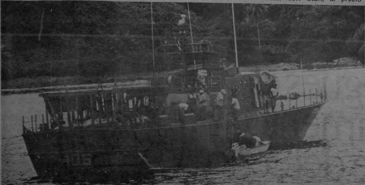
La patrullera FP 405 que condujo a la mayoría de los excursionistas a la Isla del Coco. A su cargo estará también la vigilancia del patrimonio que representa para Costa Rica dicho territorio insular.

Por otra parte, la Isla del Coco servirá como fuente de abastecimiento para las patrullas, marinas y áreas, que en un futuro cercano velarán porque se respete nuestra soberanía en esos 500 mil kilómetros cuadrados de mar patrimonial, ya que la tesis del actual gobierno, según lo expresó el presidente Carazo al llegar ahí, "es ejercer la soberanía costarricense en esas aguas, no importa los obstáculos que encuentre a su paso en esta lucha".