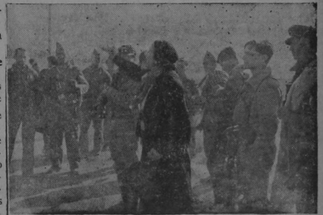
La Pasionaria arenga las tropas que parten para Aragón