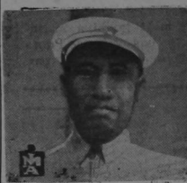
GENERAL CHU TEH

Comanda el 8º Regimiento de Infantería (Antiguo Ejército Rojo Chino) quien es en gran parte responsable por los éxitos de las fuerzas chinas en el frente Norte