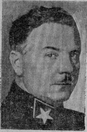
MARISCAL VORSHILOV COMANDANTE EN JEFE del EJÉRCITO ROJO quien ha sido electo recientemente como miembro del Parlamento Soviético

"infame" dictada por el actual Gobierno El Presidente Cortés es responsable ante la conciencia de América de la suerte que corran estos 3 hombres cuya vida él sabía de antemano que estaba amenazada