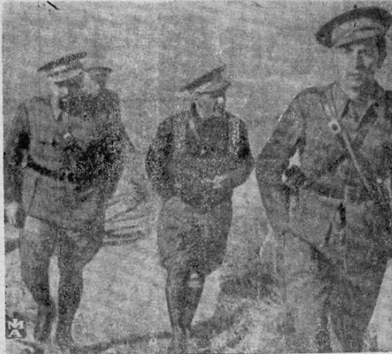
El General Campesino, en compañía de otros oficiales, inspeccionando el frente de Teruel

En todas partes en donde la guerra española ha pedido arrojo, allí ha llegado el Campesino y cuando el pueblo sabe que en sitio de peligro está el Campesino, sonríe tranquilo. Peleó contra los fascistas en el Guardarrama con el batallón de campesinos que organizó a la carrera en aquellos días en julio del año '36 y peleó