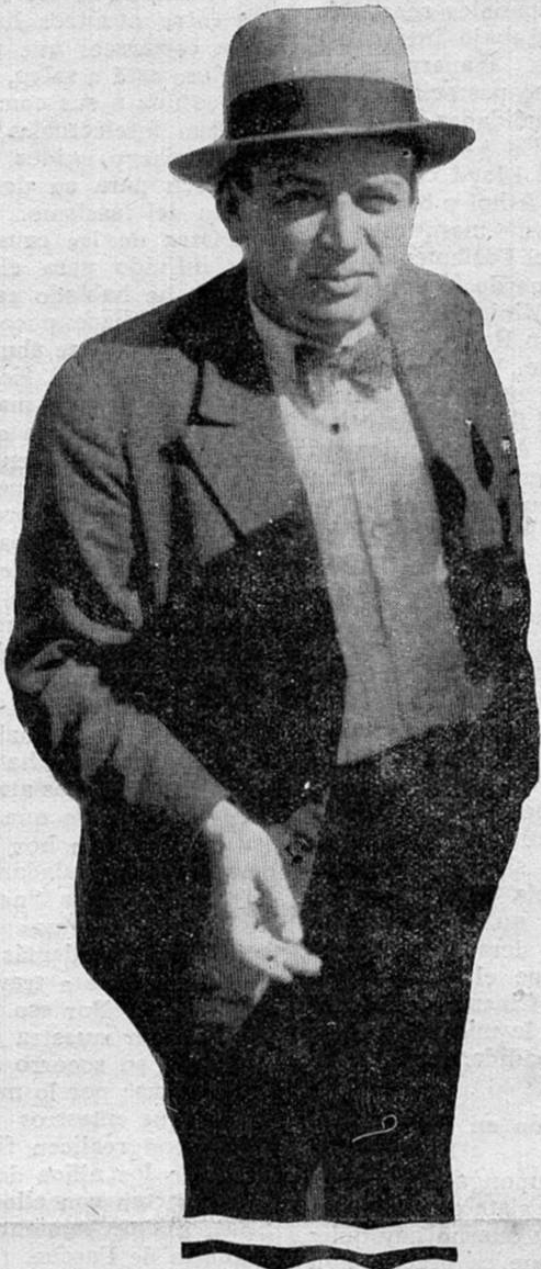
Dr. Ricardo Moreno Cañas

Frente Popular. Ahora toca a los que combatieron a su lado, no dejar volverse polvo sus anhelos, como se volverán sus restos. Sus esfuerzos no parecen haberse perdido en el vacío: la manifestación imponente que fue su entierro, nos lo está diciendo. El pueblo de Costa Rica había comprendido que en el doctor Moreno Cañas tenía no sólo un posible defensor de la salud de miles de individuos, sino también un decidido defensor de sus derechos. Que su ejemplo sea acicate para los pocos políticos honrados que aun le quedan al régimen liberal en Costa Rica.