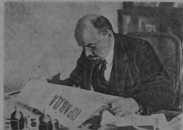
Pero figuraros un negro poseedor de cien esclavos que lucha contra otro que posee doscientos por una distribución más "equitativa" de estos esclavos. Es perfectamente claro que si en estos casos se habla de "defensa de la patria" o de "guerra defensiva" sería falsear la historia, y prácticamente sería una simple farsa de los hábiles negreros para engañar a los analfabetos, a los pequeños burgueses y a las gentes cándidas.

"Las guerras hicieronse todavía más inevitables a fines del siglo XIX y comienzos del XX, al pasar el capitalismo, definitivamente, a la fase culminante y última de su desarrollo; el imperialismo y las guerras de los Estados