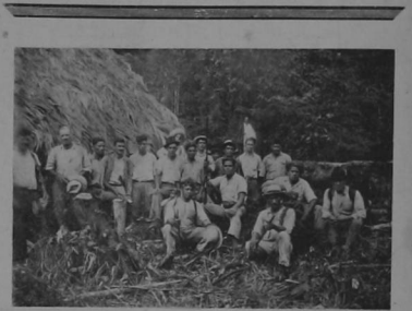
Grupo de expedicionarios acampando en un rancho en la montaña.

Se les pide en forma urgente ponerse al día en sus cuentas con el periódico. La falta de pago tanto de muchos suscritores como agentes ha producido una situación muy difícil a nuestro semanario, que debe ser resuelta con un esfuerzo para cancelar los saldos atrasados.