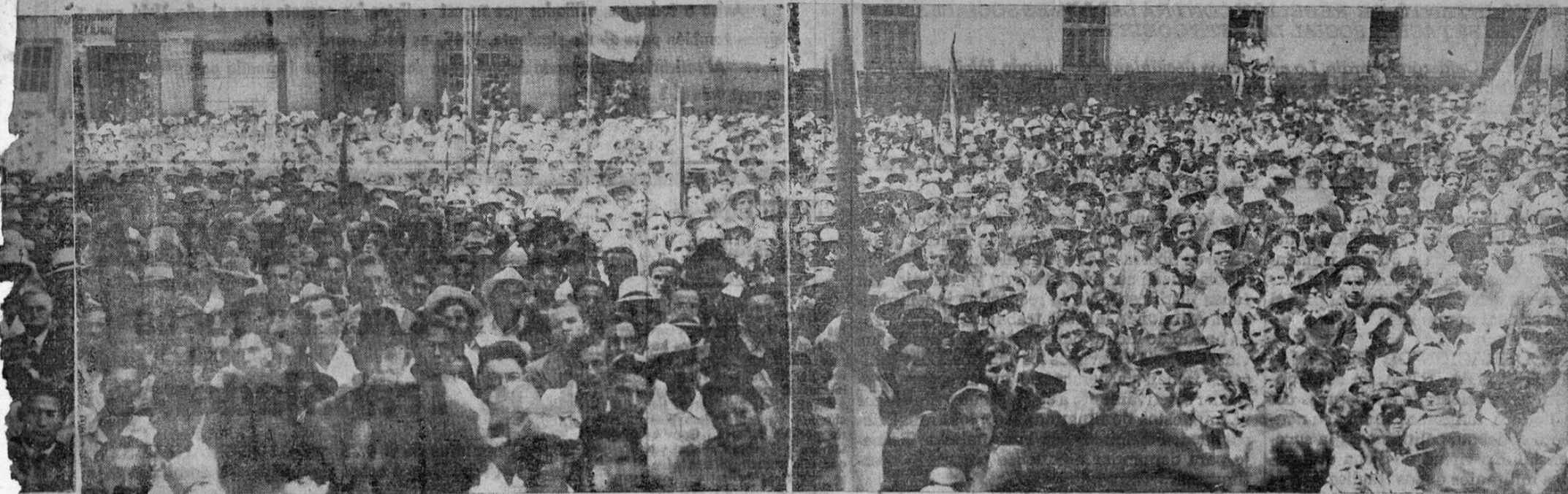
QUE REPRESENTA UN PROGRAMA DE GOBIERNO