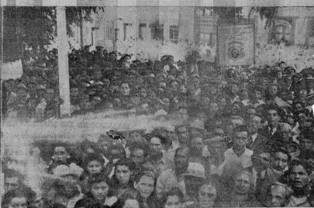
MILES DE ALAJUELENSES ACLAMAN A TEODORO PICADO