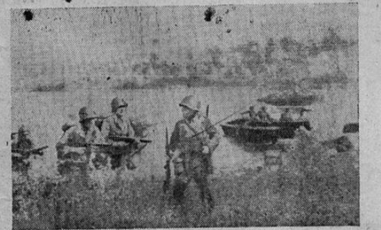
Fuerzas de los Estados Unidos al mando del General Douglas MacArthur desembarcan en la Isla de Los Negros, del archipiélago del Almirantazgo, en el suroeste del Pacífico. La rápida operación de flanco ha dejado a 50.000 soldados japoneses completamente aislados de sus bases de aprovisionamiento. Foto transmitida por radio.