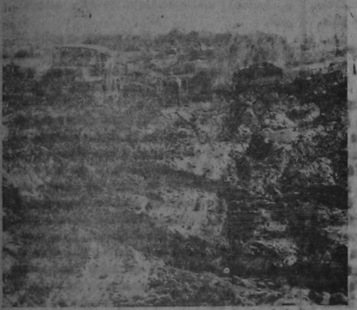
Ejércitos aliados avanzando por los lodazales de Italia

WASHINGTON. — En su mensaje al Congreso sobre la "situación del país," el Presidente Roosevelt se refirió a la importancia del frente italiano en la estrategia de guerra aliada contra Alemania, y rindió tributo al valor y a la habilidad combatiente de los soldados de las Naciones Unidas, teniendo también palabras de encomio para las fuerzas brasileñas. El señor Roosevelt declaró que las valerosas fuerzas aliadas en Italia están desempeñando un papel de notable importancia en nuestra estrategia en Europa, manteniendo constante presión contra unas veinte divisiones alemanas de primera línea y los suministros, transportes y tropas de reemplazo necesarios. "Todos los cuales son necesarios tan urgentemente por nuestros enemigos en otras partes."