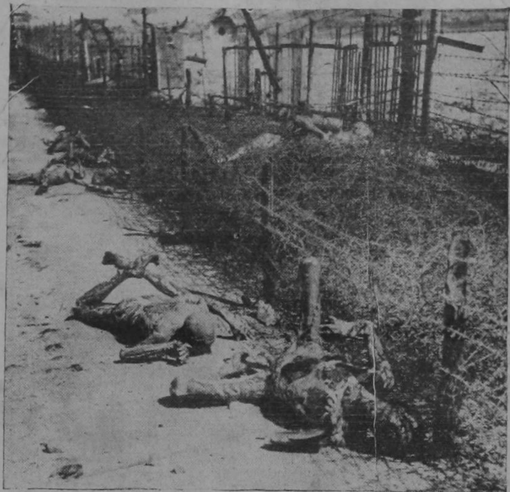
La fotografía de arriba fué tomada por los fotógrafos norteamericanos cuando las tropas de los Estados Unidos llegaron a uno de los muchos campos de concentración que Hitler, Goering, Goebbels, Himmler y toda su pandilla sembraron en toda Alemania. Es el campo de concentración de ERLA. Aquí fueron quemados centenares de hombres y mujeres vivos con acetato. Con estos criminales no se puede tener clemencia. No se puede tener piedad con los nazistas, que sentaron como principio que "la clemencia es una concepción alemana. La palabra "clemencia" es uno de los muchos términos de la Biblia, con los que no podemos tener nada que ver".

si hicieran, francamente, campaña contra los Estados Unidos o contra Inglaterra. La táctica escogida es otra: agitar el fantasma comunista y tratar de meter la cizaña en las relaciones entre la URSS y Para esta clase de maniobras las potencias democráticas usarán a los falangistas españoles y muy especialmente a los legaciones de Franco esta (Pasa a la pág. 3)