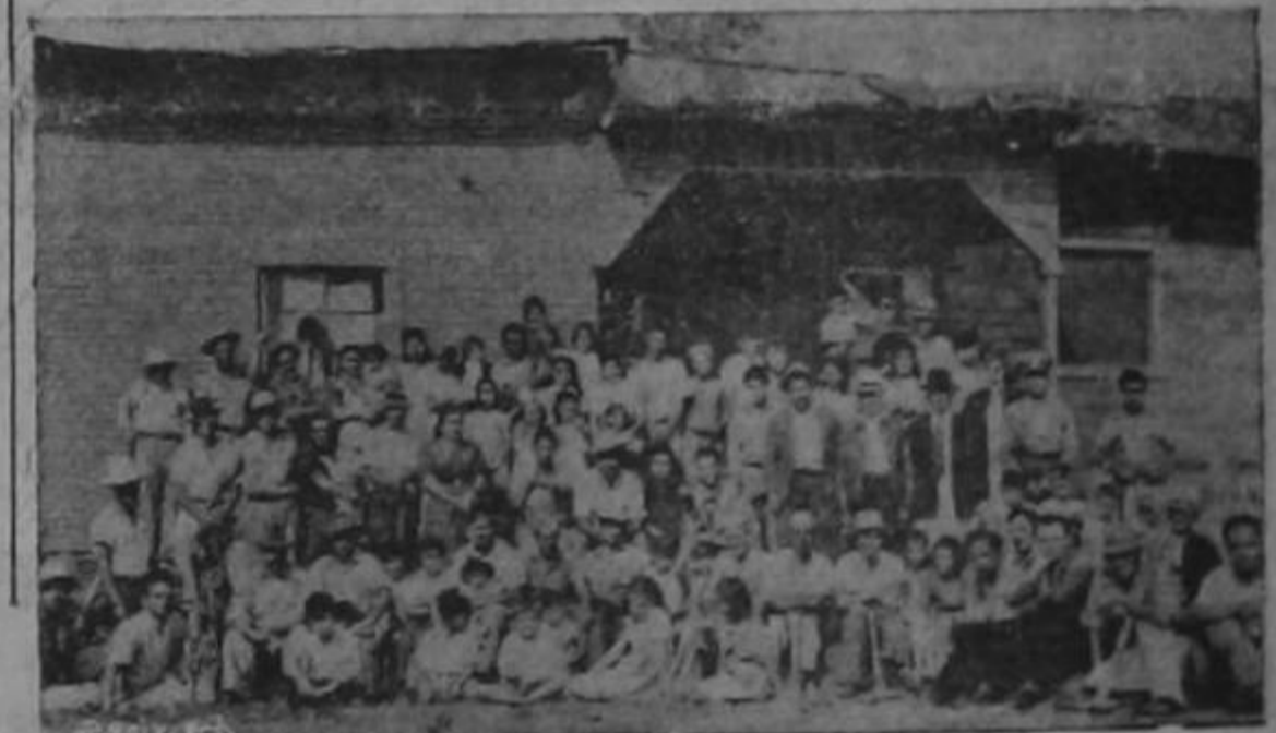
Unidos para conseguir la cañería; el pueblo de Guadalupe no sabe de divisiones políticas. Sabe que el pueblo unido, que el pueblo organizado, lo decide todo. Y Guadalupe decidirá la construcción de su cañería bajo el signo de la unidad.

Todos los nazis que en América han visto esta espantosa guerra desde la barrera, que no han perdido seres muy queridos, están ahora con la conditadita de que es inevitable que estalle ya la TERCERA GUERRA MUNDIAL. Es inevitable la TERCERA GUERRA MUNDIAL—afirman muy tranquilos, bien arrepolloados en un sillón o mientras se tóman un jaibol en una cantina de moda. Que los nombres americanos, ingleses y rusos se desangren en los campos de batalla; que los muchachos más jóvenes y mejor conformados queden hechos un guiñapo humano; que en los hospitales haya millones de seres (Pasa a la pág. 2)