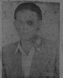
c. CARLOS LUIS FALLAS

No es, Gentes y Gentecillas una obra complicada de argumento y trama convencional o artificioso al estilo folletinesco y cursi. En el libro, el tema, la tesis que se plantea fundamentalmente en las múltiples incidencias de una vida de dolor y miseria, de