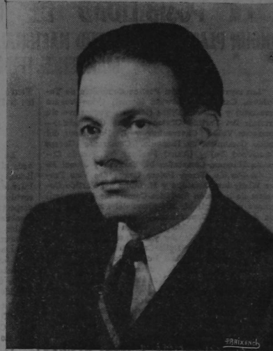
Diputado CARLOS LUIS FALLAS, Secretario General del Sindicato Bananero.