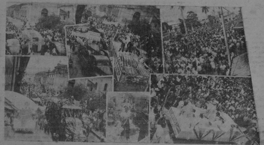
VARIOS ASPECTOS DE LA grandiosa manifestación organizada por la C.T.C.R. el 12 de Octubre. — Una nueva derrota para la oposición. Una nueva afirmación de fe democrática. Fué ese acto una vibrante demostración de apoyo al Código de Trabajo, las Garantías Sociales, el Impuesto sobre la Renta y la Ley de Tierras.

Secretaría de Organización del Sindicato de Trabajadores del Calzado de San José.