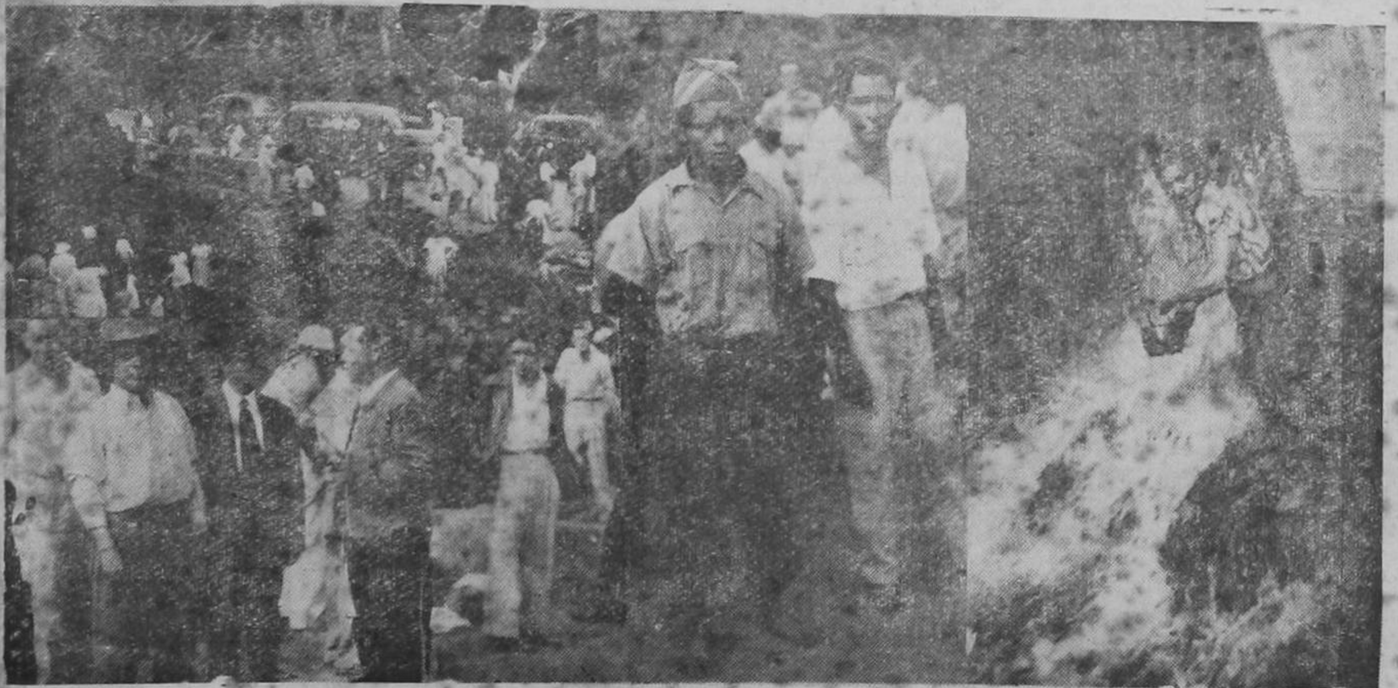
tro redactor gráfico Nestor Castillo tomó en la mañana de hoy, en Ocloro, estas fotografías que demuestran la salvaje voladura de la cañería capitalina, por las personas que esta madrugada colocaron varias bombas de dinamita, una de las cuales logró estallar, haciendo volar el tubo madre de la cañería, dejando a la capital sin una gota de agua. 1. Lugar de la explosión.— 2. El gobernador de la provincia Ing. don Jalme Granados acompañado de otras personas haciendo inspección en el teatro de los acontecimientos y 3 vista general del sector en que fue llevado a cabo el acto de sabotaje. Una segunda bomba de dinamita fue localizada a última hora, descubierta por las autoridades, sobre la misma red de cañería, la cual no logró estallar.