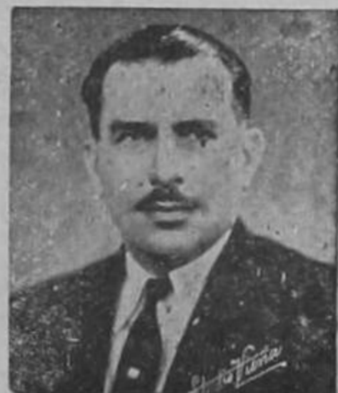
Lic. Teodoro Picado