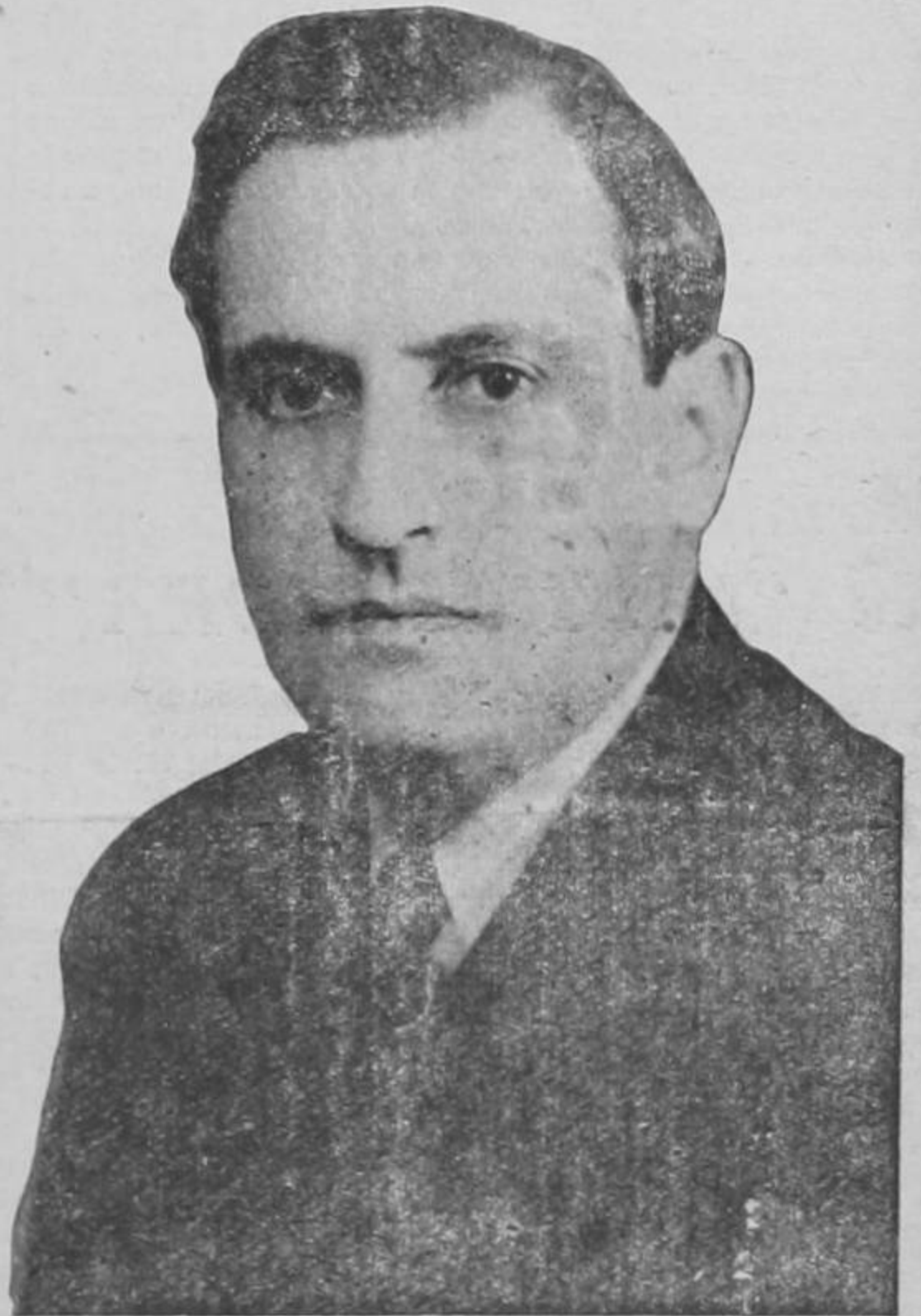
Sr. Expresidente de la República Dr. RAFAEL A. CALDERON G.

Ulate . . . . . 1193 Castro Cervantes, 812