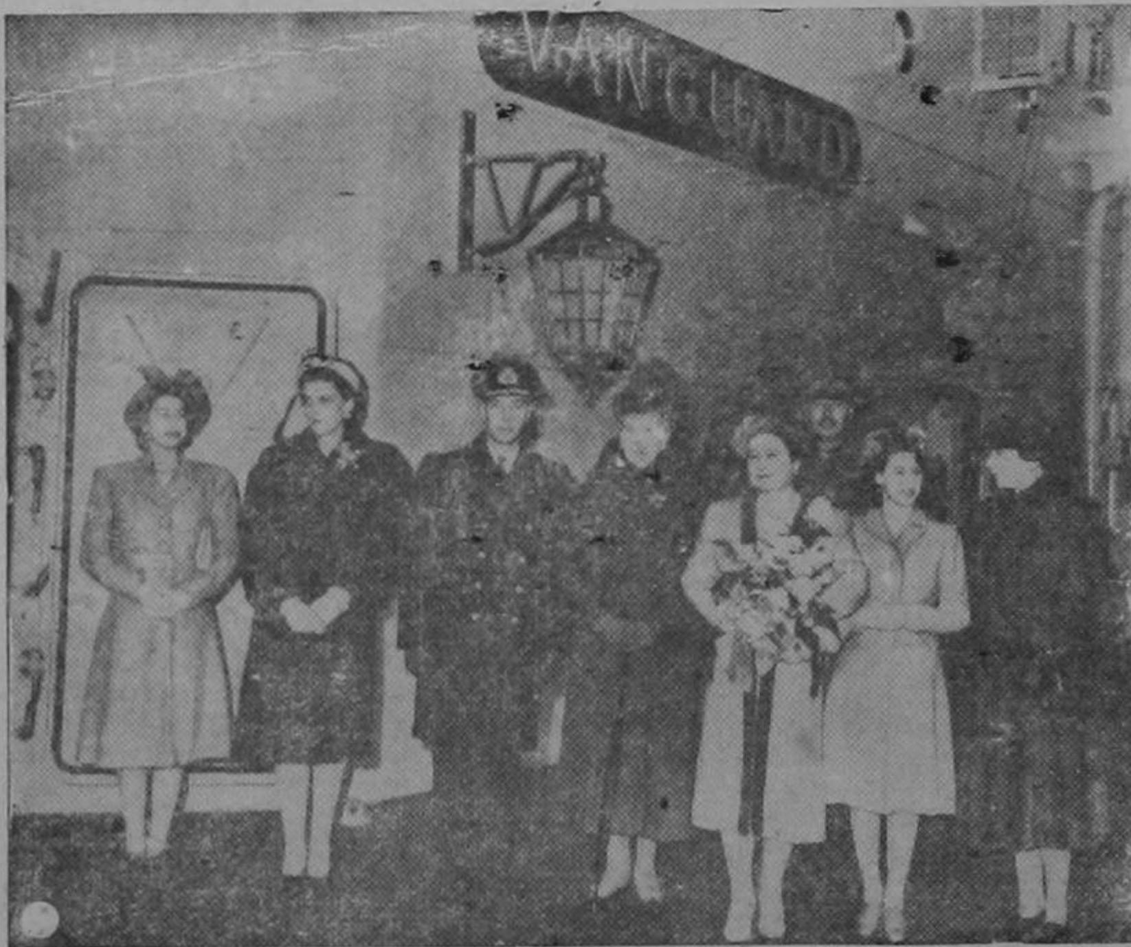
Los Reyes de Inglaterra posan para los fotógrafos de NEA TELEPHOTO SERVICE en los precisos momentos en que abordan el H. M. S. VANGUARD, anclado en el puerto de Portsmouth, Inglaterra, momentos antes de salir en gira por el Africa del Sur. De izquierda a derecha aparecen, la bella princesita Elizabeth, la Duquesa de Kent, el Rey Jorge VI, la reina Madre, María, la reina Isabel, el Duque de Gloucester (aparece vistiendo uniforme en la parte de atrás), la Princesa Margarita Rosa y la Princesa Real.