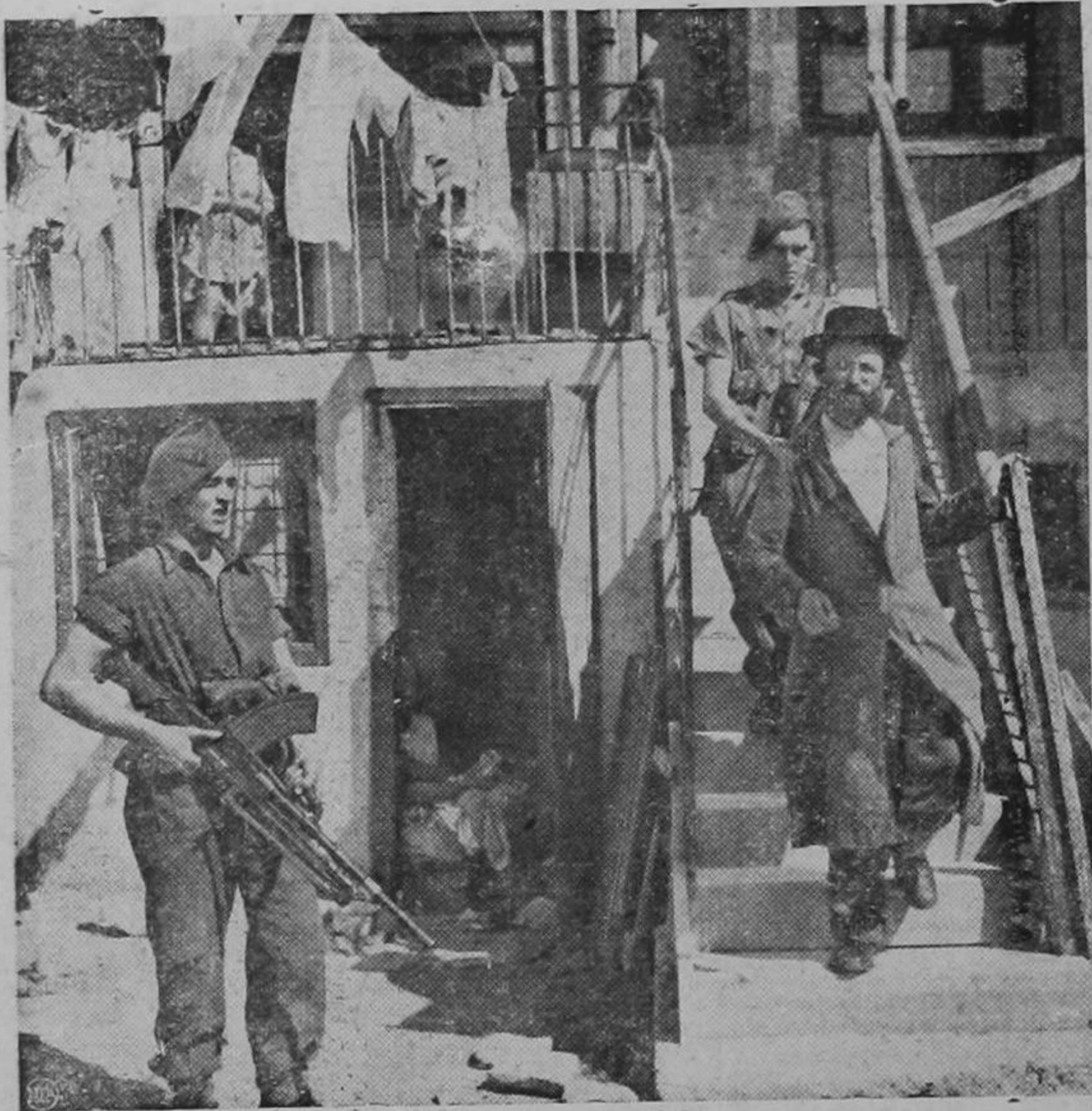
... NEA PHOTO SERVICE envió a ULTIMA HOORA varios aspectos de la situación actual en Palestina, donde existen 20 mil efectivos de las fuerzas británicas. Puede verse, izquierda, parte superior, un aspecto del Tel-Aviv.—Derecha: un soldado británico conduce, detenido a un judío de quien se sospecha que es terrorista.—Un miembro del ejército británico haciendo guardia en una calle del puerto de Haifa, donde, como en Tel-Aviv y en otros lugares de Tierra Santa, diariamente están ocurriendo motines

AUTORIZACION A LA MUNICIPALIDAD DE ESE CANTON PARA LA FINANCIACION El proyecto respectivo ha sido sometido a la aprobación del Congreso