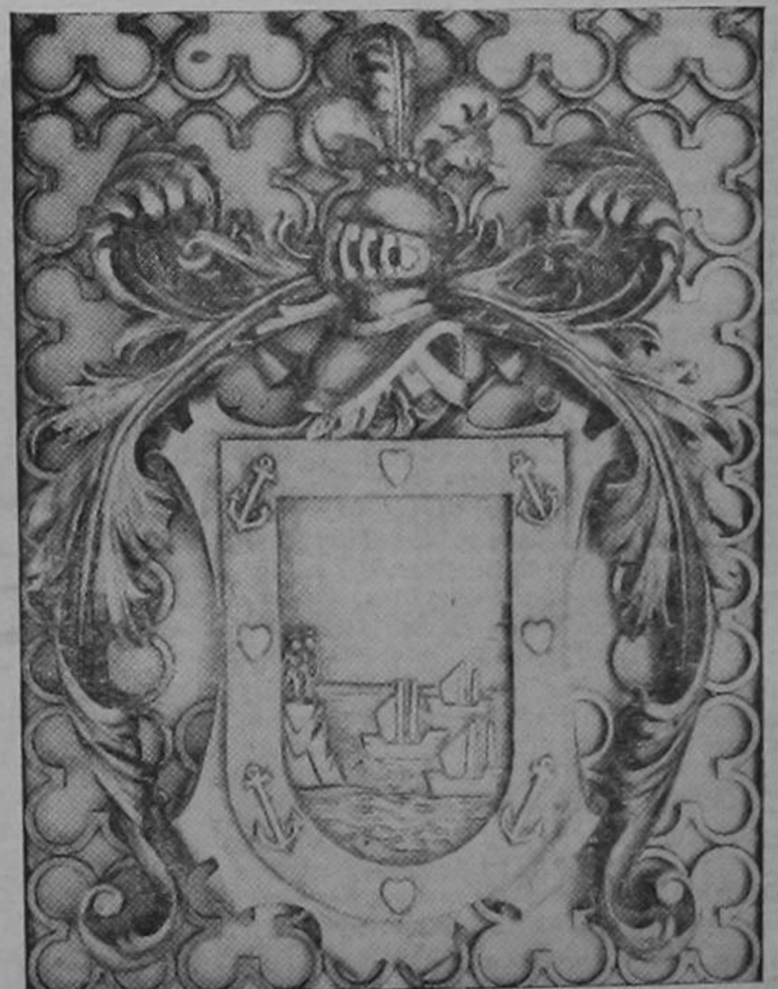
JOYA EN TALLA DE "EL SESTEO"