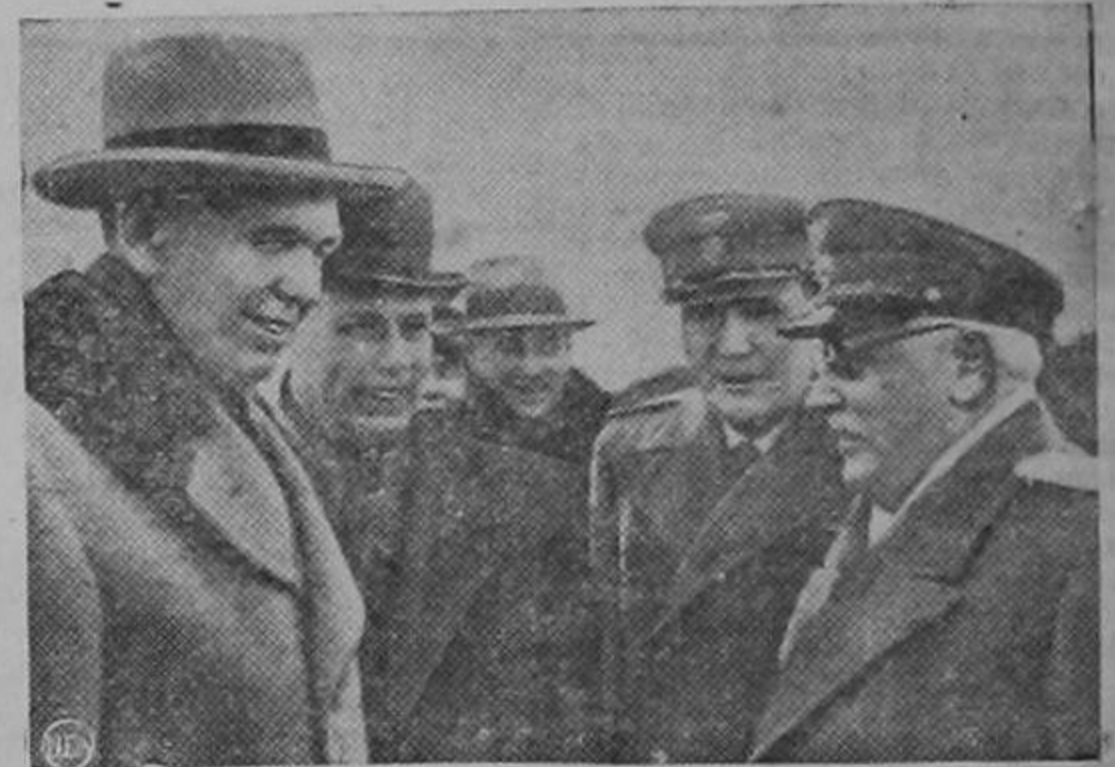
El sub-comisario de relaciones exteriores de la Unión Soviética y otros altos personajes rusos dan la bienvenida al general Marshall en el momento de su arribo a la capital roja para asistir a la Conferencia de los Cuatro Grandes