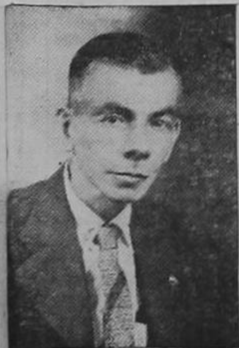
DON CARLOS ROLDAN

LUCKY LUCIANO SALE HOY PARA ITALIA LA HABANA, 20. EP. — El buque turco BAKIR llevando a bordo al exgangster de New York Charles Lucky Luciano partirá esta tarde del puerto de La Habana rumbo a Italia. Luciano abandonó la república de Cuba como extranjero indeseable.