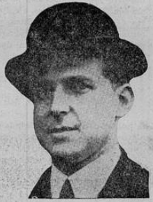
PRINCIPE DON JUAN

español en forma práctica. Agregó que unas elecciones celebradas libremente demostarían que una mayoría decisiva está en favor de la monarquía. No dijo qué era lo que los Estados Unidos y la Gran Bretaña deberían hacer.