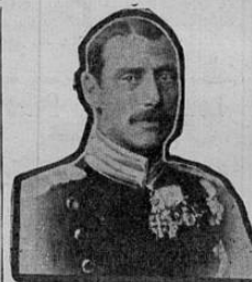
Rey Cristián de Dinamarca

Como Empleado Judicial Debo Estar al Margen de la Política y así lo Estoy