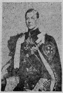
DUQUE DE WINDSOR

EL DUQUE DE WINDSOR AYUDO A SOFOCAR ESTA MAÑANA UN INCENDIO EN NUEVA YORK