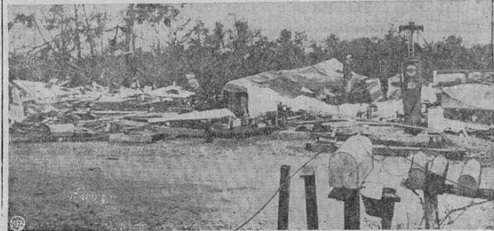
La ciudad de la Unión, Arkansas, recientemente fué azotada por un tornado, causando la muerte de 37 personas y gran cantidad de heridos, así como la destrucción de gran número de edificios. Esta gráfica da a nuestros lectores una idea de la catástrofe.

Probablemente según informes que hemos tenido en la reunión del Partido Social Demócrata verificada el miércoles pasado y a la cual asistió don Otilio Ulate, entre los asuntos que allí se trataron estuvieron las duras críticas que elementos de aquella agrupación hicieron a la jefatura de propaganda ulatista, por su falta de capacidad en la organización de las asambleas y que se