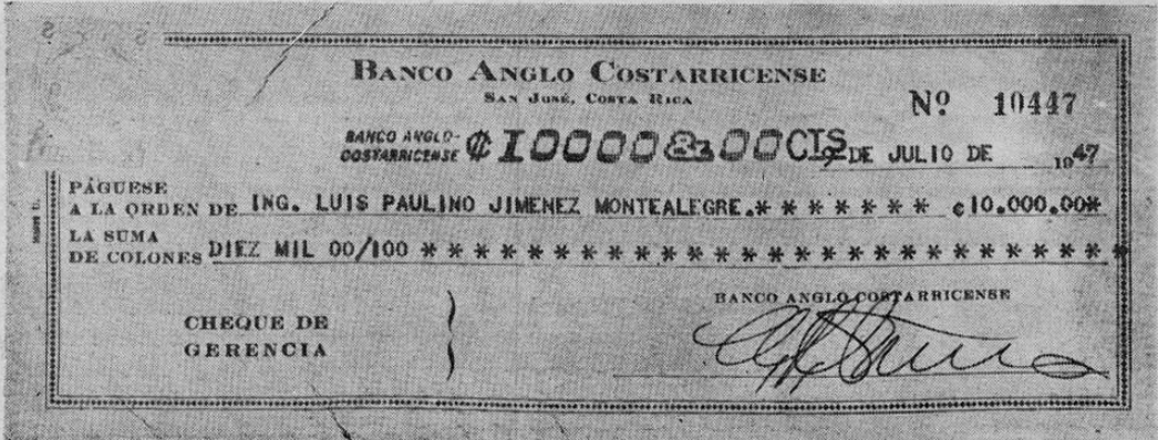
Facsimil del Cheque por DIEZ MIL COLONES para casar la apuesta. —

COMITE CALDERONISTA DEL CANTON DE SAN CARLOS.