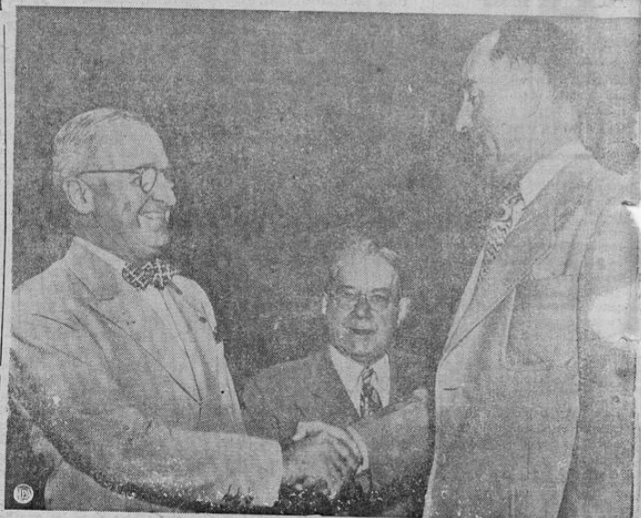
Momentos en que el Presidente Truman llegaba el jueves pasado sorpresivamente al Senado norteamericano.